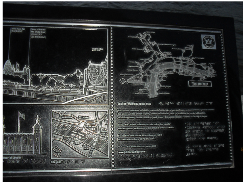
Fot. Przykładowe rozwiązanie Panelu (Londyn-Tower Bridge)