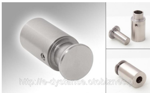
Fot. Dystanse do mocowania w ścianie.

wielowarstwowych płytach aluminiowych o grubości 9mm z wewnętrznym rdzeniem polietylenowym (3+6mm), minimalny okres gwarancji - 5 lat. Druk musi gwarantować estetyczny wygląd, wierność odwzorowania kolorów i fotograficzną jakość obrazu. Zarówno druk jak i materiał charakteryzują się wysoką odpornością na warunki zewnętrzne. Materiał łatwy w obróbce mechanicznej.