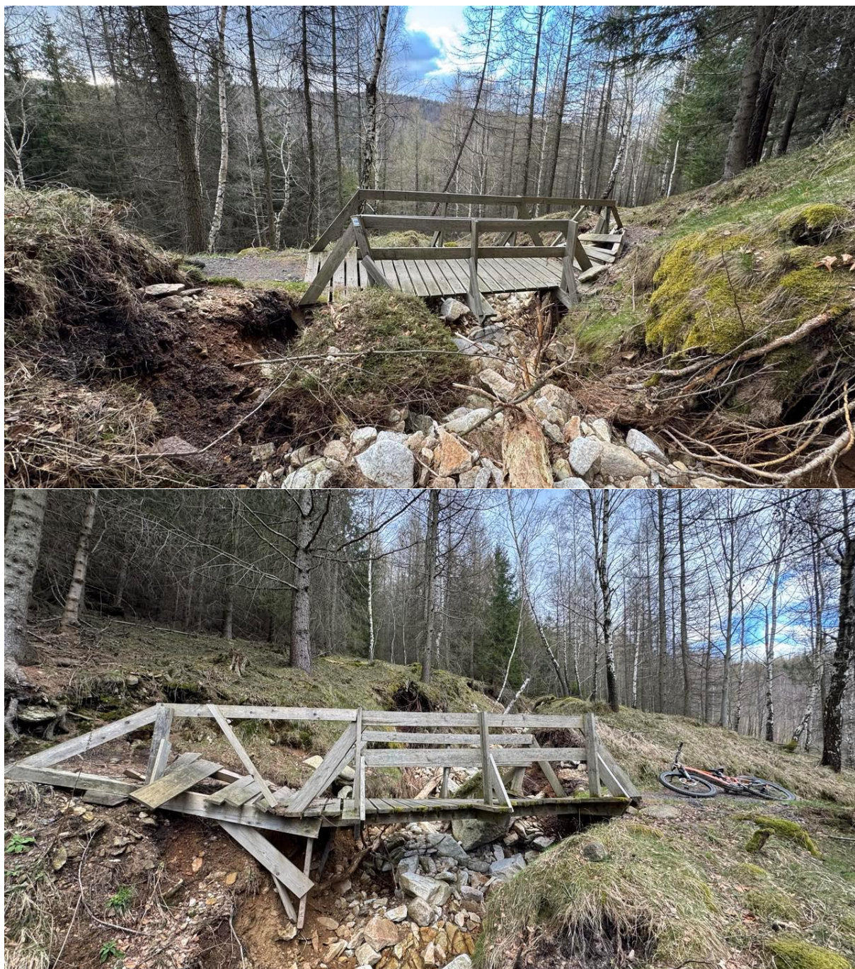
14. Na końcu trasy, odcinek nr 1 : uzupełnić 5 m (3 dziury) + dodać 1 odwodnienie poprzeczne z rurą 16 cm.